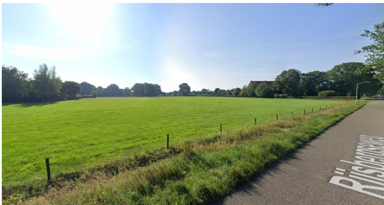
Zicht op noordoostkant Effen (Google)